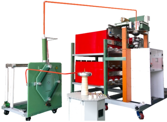
● 实验室主体(具体造型与体积依据客户需求而定)

型号：AT3181-(40/60/80/100/120 /160/200/250)-D-S